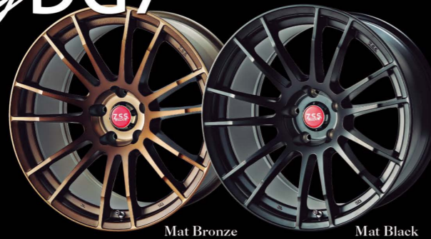
Mat Bronze Mat Black