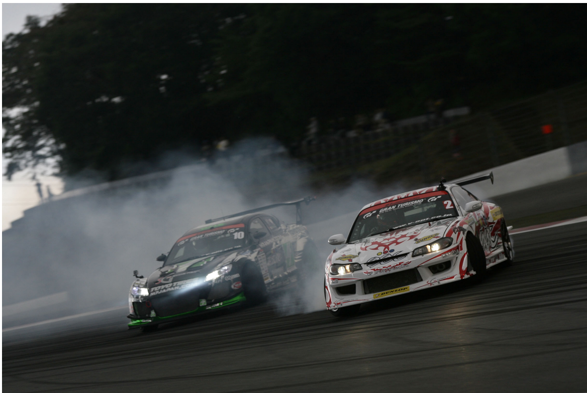
■決勝追走 末永正雄選手 (写真左) v s 今村陽一選手 (写真右)

一方今村陽一は、追走 2nd. Stage (ベスト 16) で時田正義 (Goodyear Racing ZERO CROWN)、続くベスト8では川畑真人 (Team TOYO TIRES DRIFT with GP SPORTS)、ベスト4では高橋邦明 (GOODYEAR Racing with kunny's) を再戦の末破り、同時にシリーズ獲得ポイントで斎藤太吾を上回り通算4度目、3年連続シリーズチャンピオン獲得を決定。さらに決勝で対戦した末永正雄を倒し、今季2勝目の総合優勝を飾った。