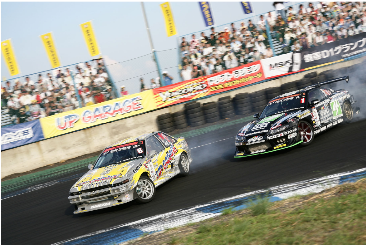
■ 2010年エビス大会の走り 日比野哲也選手（写真左）・今村陽一選手（写真右）追走