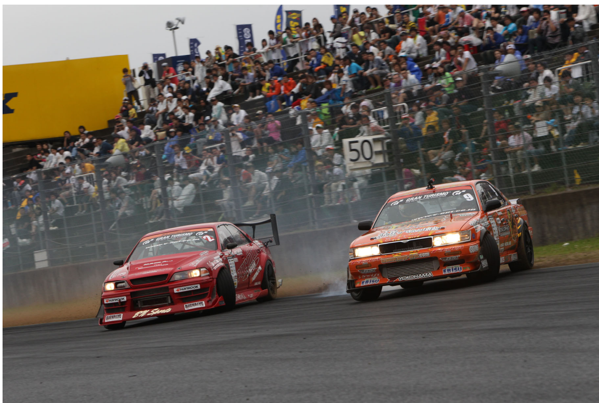
追走トーナメント決勝戦 (左：斎藤太吾 VS 右：熊久保信重)

同時に単走と追走のポイントを合計した総合順位は、1 位熊久保信重、2 位斎藤太吾、3 位今村陽一だった。