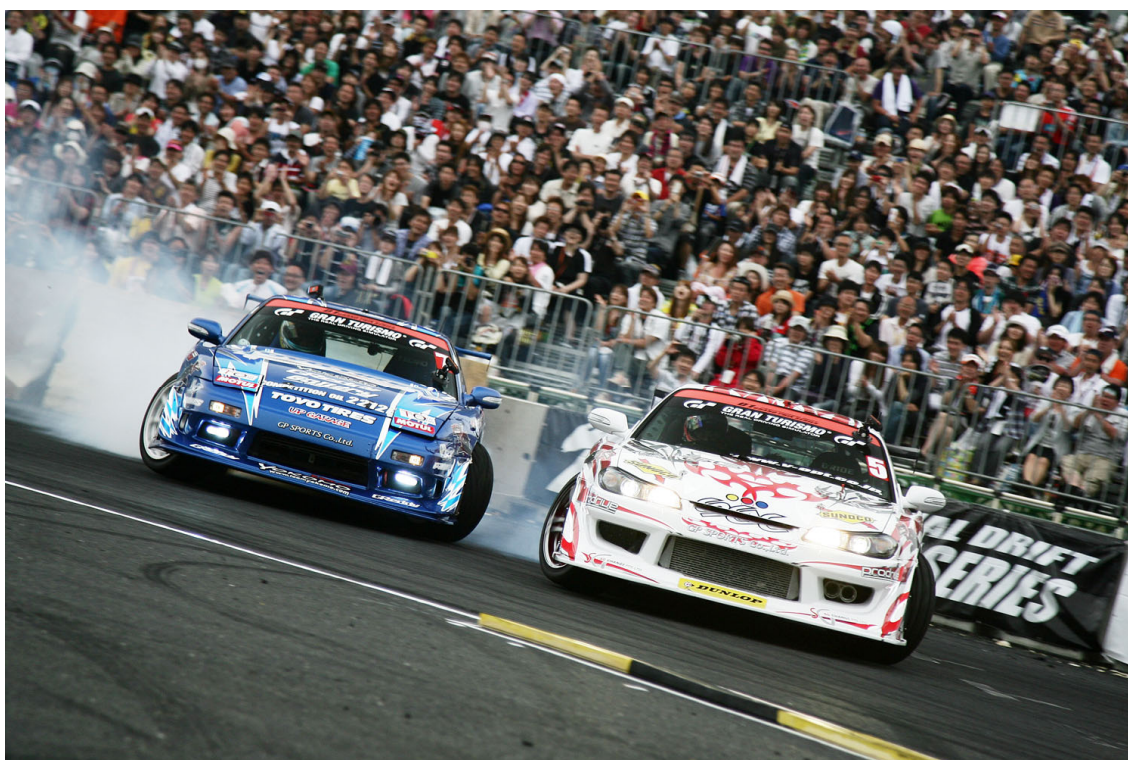
第2戦追走トーナメント決勝 (左: 川畑真人 VS 右: 今村陽一)