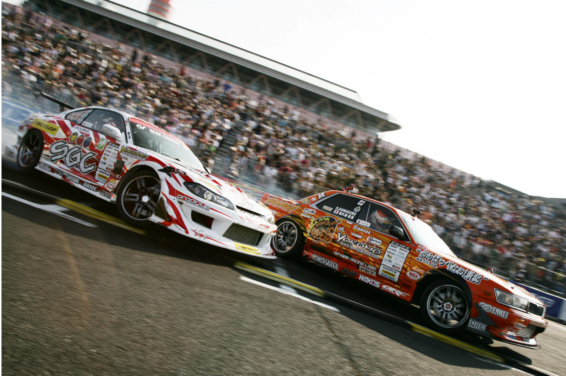
追走トーナメント決勝戦（左：今村陽一 VS 右：熊久保信重）