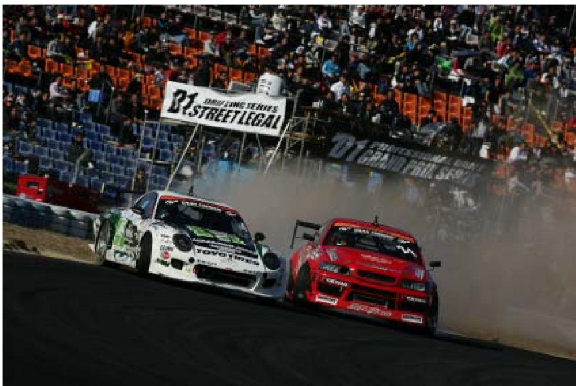
2010 オートポリス大会決勝 末永選手（写真左）・斎藤選手（写真右）追走