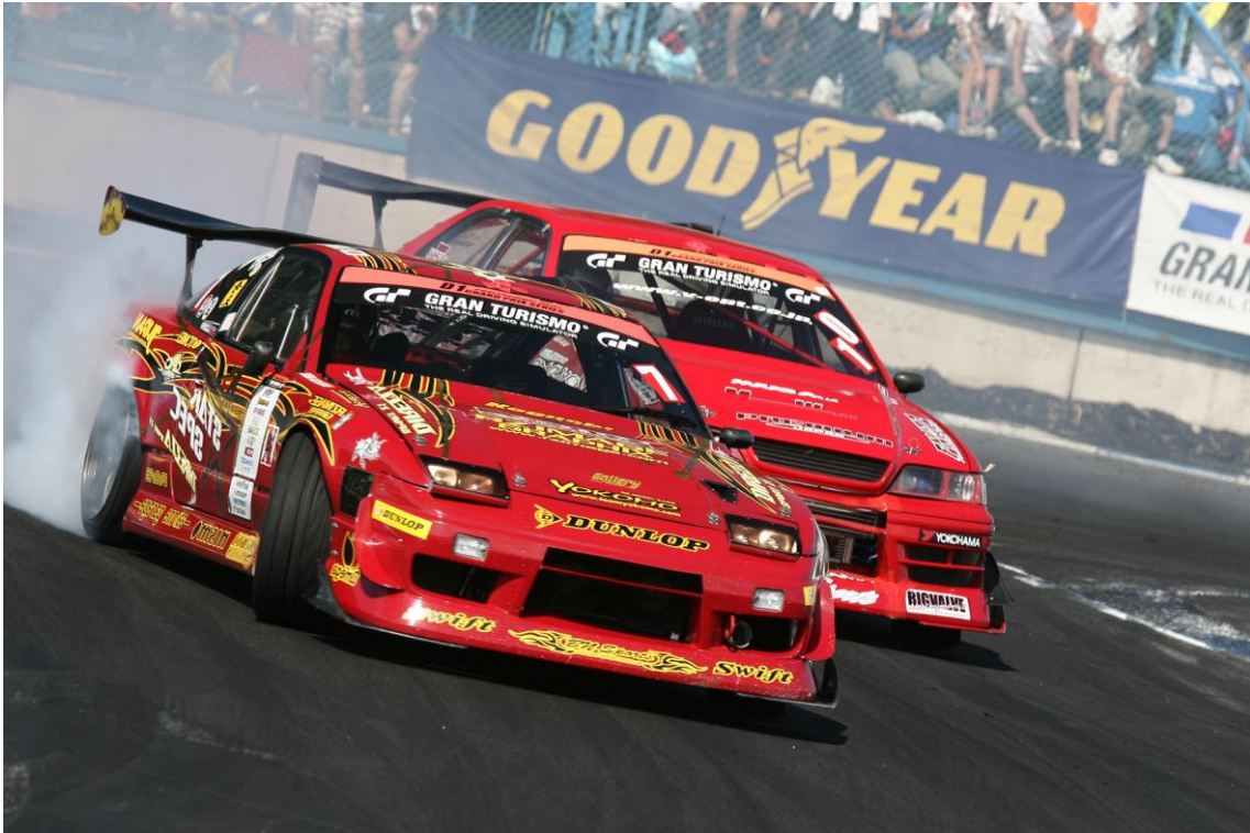
シード権をかけて激しく争う古口美範（180SX）VS 斎藤太吾（マークII） （第6戦エビス）